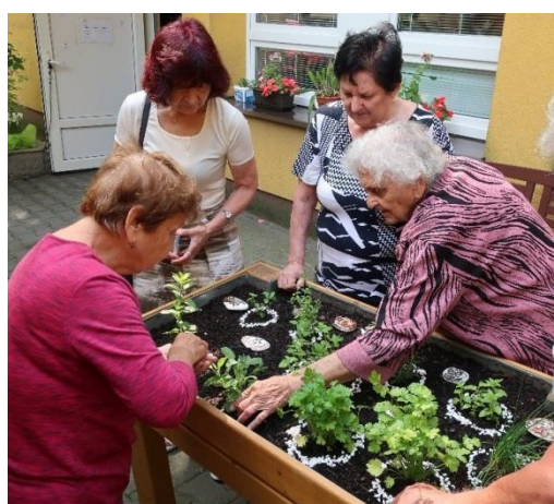
práce s mobilní zahrádkou