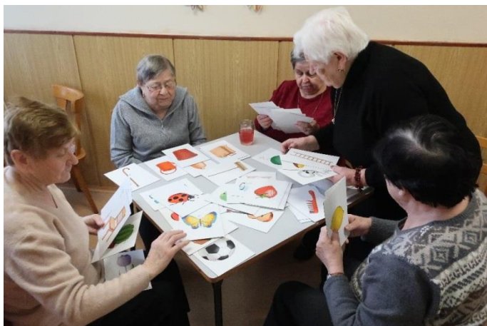
cvičení kognitivních funkcí