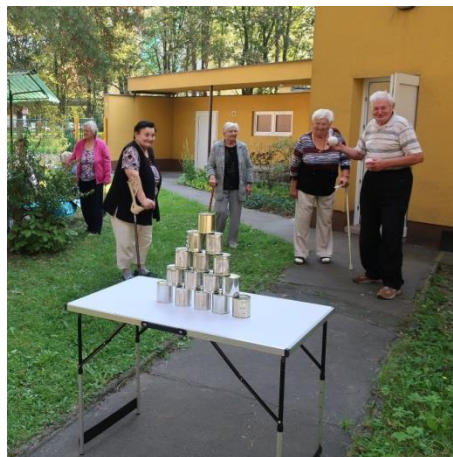
pohybové aktivity v přírodě