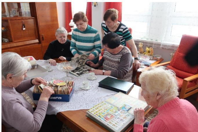
reminiscence na téma sběratelství